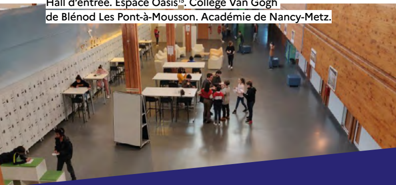
Hall d'entrée. Espace Oasis 15 . Collège Van Gogh de Blénod Les Pont-à-Mousson. Académie de Nancy-Metz.

Construire la confiance. Les parents ne sont pas des élèves. Leur accueil doit se faire dans un espace particulier aménagé avec soin. Un lieu calme, agréable, coloré qui favorise l'échange et inspire confiance. Une table ronde. Des fauteuils, une banquette, une table basse... Le salon des parents. Une ambiance chaleureuse pour inciter à la discussion sereine, à l'échange constructif.