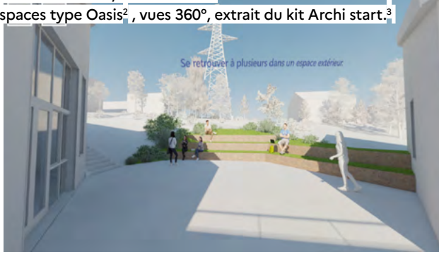
Différentes cours, lieu d'accueil. Espaces type Oasis 2 , vues 360°, extrait du kit Archi start. 3