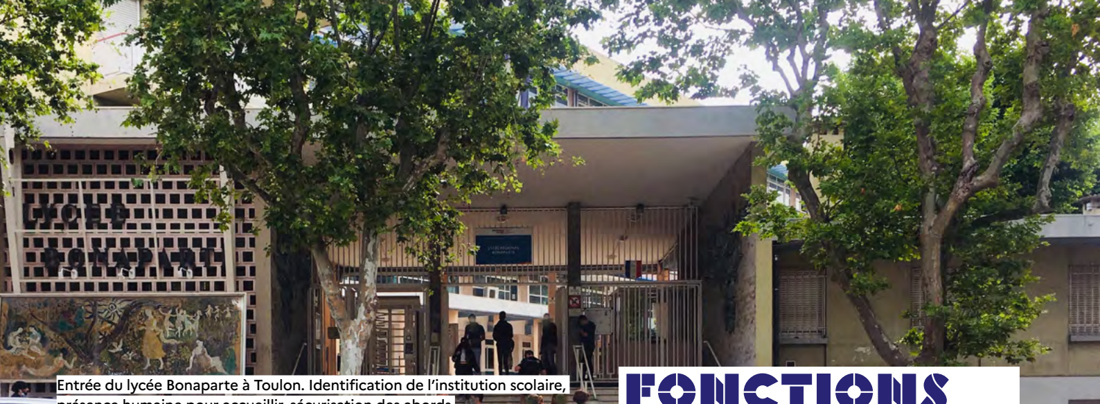
Entrée du lycée Bonaparte à Toulon. Identification de l'institution scolaire, présence humaine pour accueillir, sécurisation des abords.