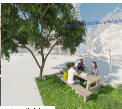
Coin ombragé pour interaction ou travail dehors. Cour du lycée Bonaparte, académie Nice.