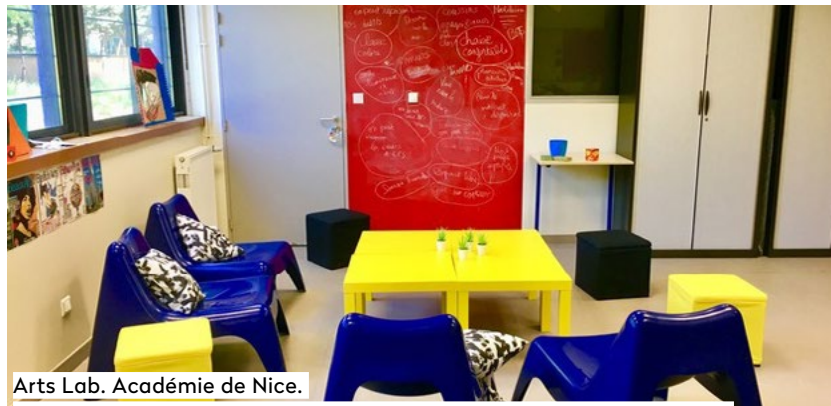
Arts Lab. Académie de Nice.

Utilisation de mobilier coloré. Segpa Lab. Délimitation du coin lecture par aplats de jaune. Mise en valeur du pilier par la couleur.