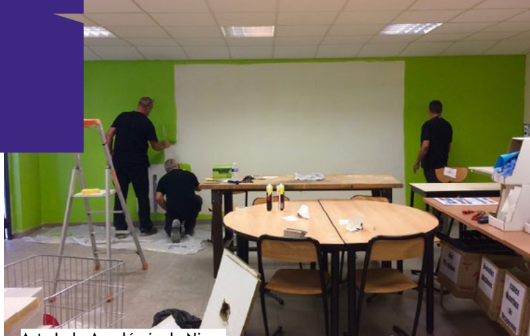
Arts Lab. Académie de Nice.

L'équipe des agents techniques du conseil départemental en train de peindre le mur-fond vert. Première incrustation réalisée avec une application sur ordi-phone.