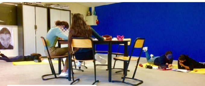
Arts Lab. Académie de Nice.

Il s'agit donc ici de travailler à un usage argumenté, raisonné et fonctionnel de la couleur dans les établissements scolaires.